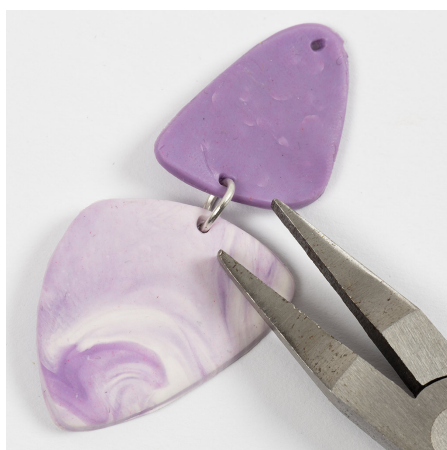
11 Klem de ring dicht met een platbektang.