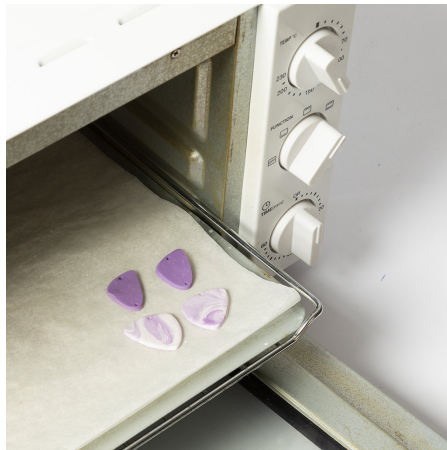
8 Verwarm de oven 10 minuten voor op 110 graden. Leg de sieradenklei na de 10 minuten in de oven en bak 18 minuten.