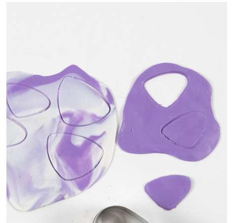
6 Steek met de vormpjes de organische vormen uit. U kunt de hele oorbel met een marmereffect maken of één deel volledig paars maken, zoals te zien op de afbeelding – of zelfs een heel andere look. Er zijn vier van de kleine vormen en twee van de grote nodig voor de twee sets oorbellen.