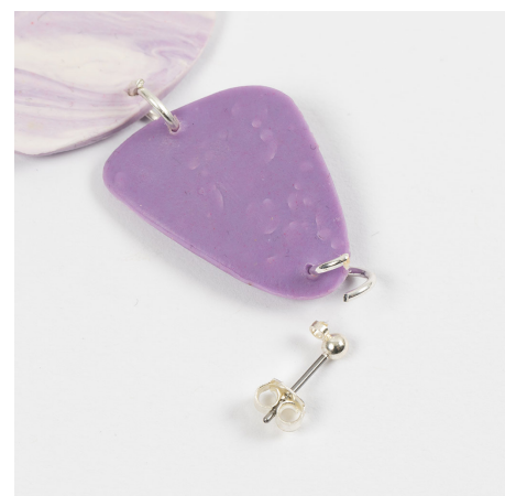
12 Steek de ring vervolgens door de bovenste opening van elke oorbel in het paar en breng de oorsteker aan.