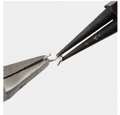
9 Draai een ring, rond open.