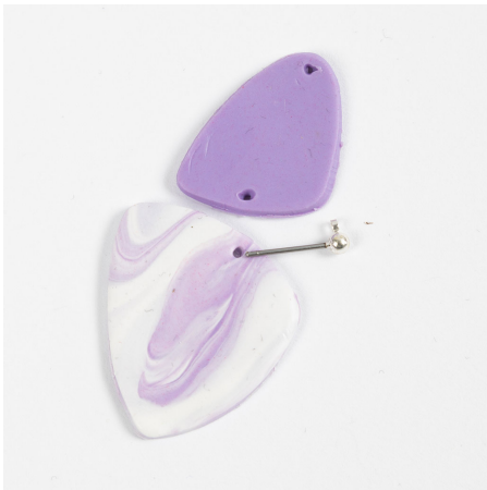
7 Steek nu een gaatje in de sieradenklei met de oorsteker waaraan de vormen moeten worden bevestigd. Zorg dat het gaatje op ongeveer 1,5 mm van de rand wordt aangebracht.