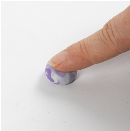
4 Druk de bal plat met uw vinger.