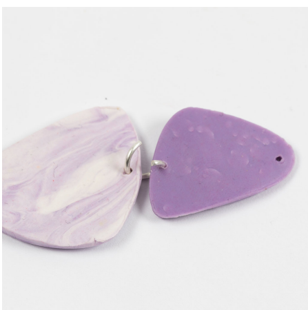
10 Schuif de uiteinden van de ring door de twee stukken gebakken sieradenklei.