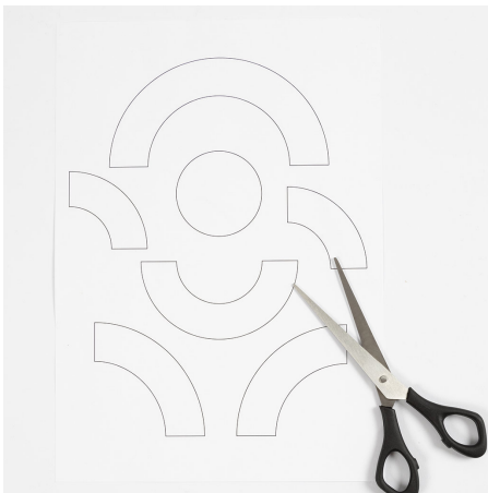
1 Knip de sjablonen uit.