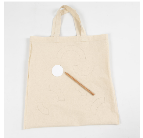
3 Gebruik de sjablonen om een patroon te maken dat u leuk vindt.