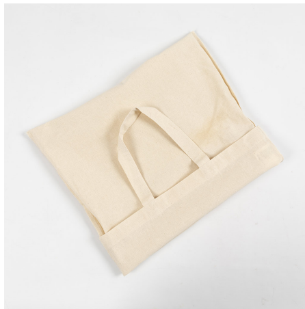
2 Keer de draagtas binnenstebuiten.