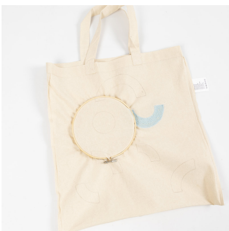
4 Breng nu het borduurframe aan. Steek het kleine stuk in de tas en plaats het grote stuk met de sluiting naar beneden over de buitenkant van de tas. Het is belangrijk dat het textiel strak wordt aangetrokken.