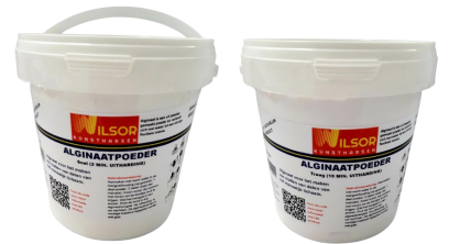
Alginaat snel en langzaam

Alginaat is een uit zeewier gemaakt poeder en verbindt zich met water tot een stevige flexibele massa.